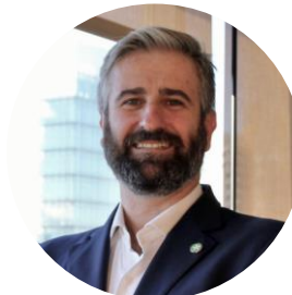
Cofundador i Soci Doctoralia