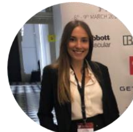
Cofundadora i CTO d'Aortyx