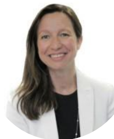
Sòcia directora Paocapital