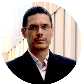
CEO de Biocat