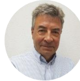
Soci Swan Medical