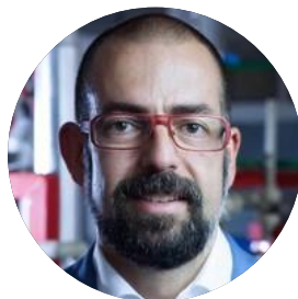
Director IQS Tech Factory