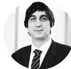
European and Spanish Patent Attorney Hoffmann