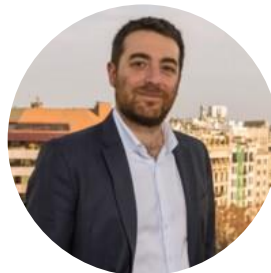
Director d'Inversions Asabys Partners