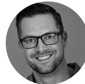
CEO i Cofundador Mowoot