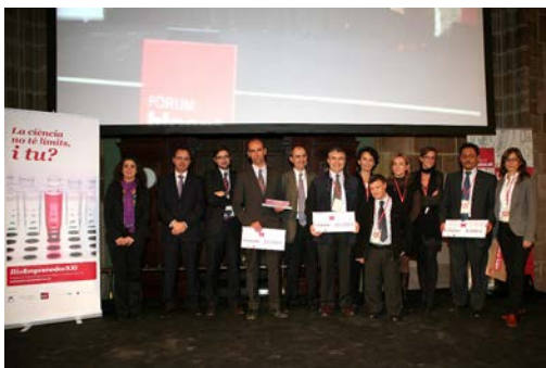
Entrega Premio BioEmprendedor XXI: VCN Biosciences