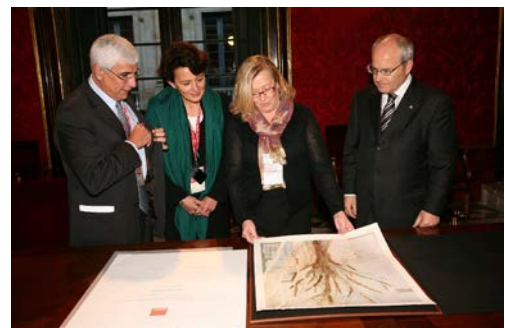
Nombramiento de la Embajadora de la Bioregión: